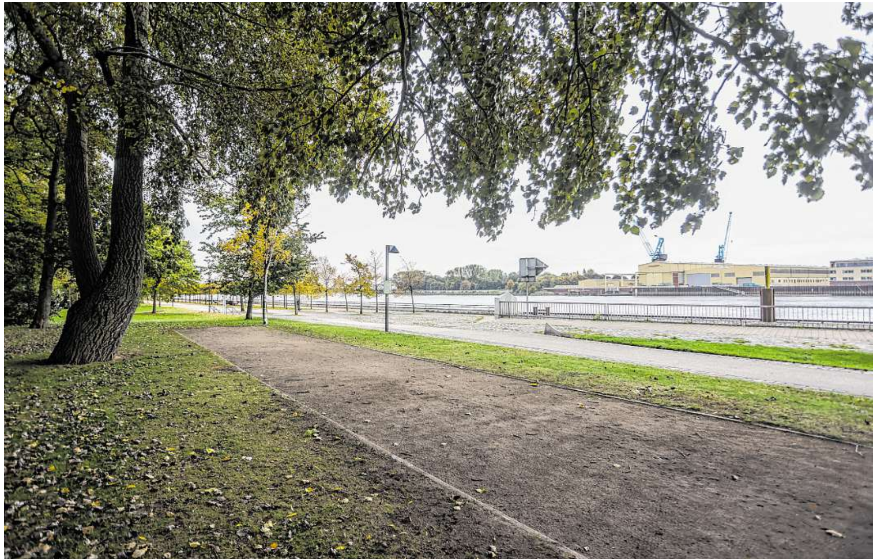
Künftig wird es auch Sitzgelegenheiten an der Boulebahn im Vegesacker Stadtgarten geben. Die Kosten dafür teilen sich Beirat und Förderverein.

Insgesamt hat der Beirat in dieser Woche rund 17.500 Euro verteilt. Damit stand mehr Geld zur Verfügung, als ursprünglich gedacht. „Anfang des Jahres hat der Beirat Repräsentationsmittel in Höhe von 1000 Euro beschlossen“, sagte Dornstedt. Pandemiebedingt sei dieser Betrag auf 300 Euro re-